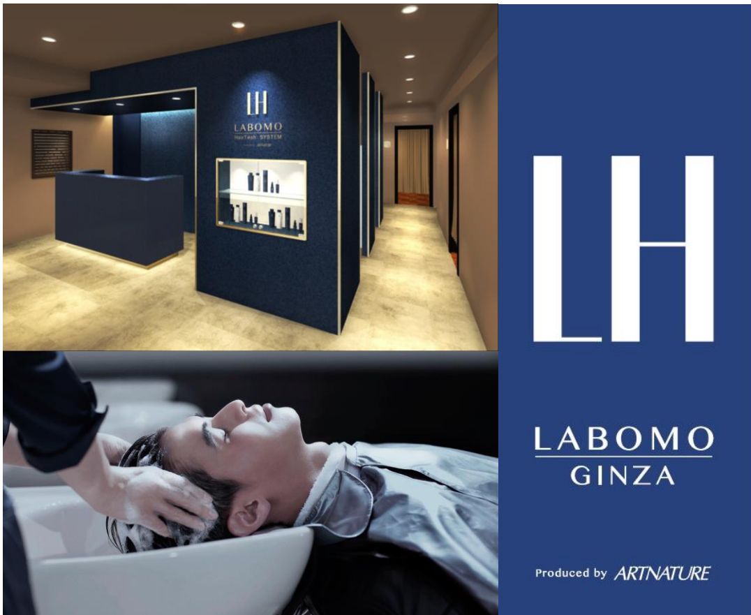
『LABOMO銀座』 店内イメージ図

『LABOMO銀座』限定のオリジナル育毛コースは、髪と頭皮に向き合いつづけて50年のノウハウをもとに開発。専門のカウンセラーが生活習慣や髪の状態などを詳しくヒアリングし、お客様一人ひとりに適したパーソナルコースをご提供します。さらにさまざまなデータから毎日の生活に役立つ最善のヘアケアをアドバイスいたします。髪のプロフェッショナルとして質の高い技術とホスピタリティを兼ね備えたスタッフが極上のリラクゼーション空間でお客様の髪と心を癒します。