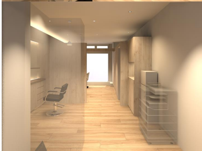
アンクス 国立がん研究 センター 東病院店 (店舗イメージ)