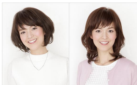
医療用ウィッグ「アックス」

https://www.julliaolger.jp/ancs/shop/index.html