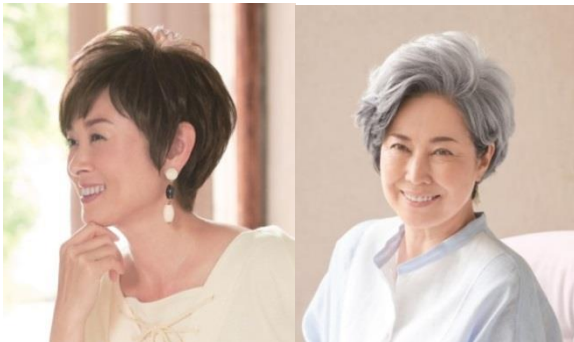
新・さららオール(写真左) 新・さらら 25FP(写真右)

『新・さらら』は、自毛や肌になじむグラデーション縫製でより柔らかく、しなやかにフィット。前髪の肌なじみもより自然になりました。人気の部分ウィッグは2サイズから選べるほか、新たにスタイリッシュなオールウィッグもラインナップにプラス。髪色もご要望の高いダーク系、白髪に自然になじむグレイッシュカラーを追加するなど、彩りゆたかなカラーを取り揃えました。