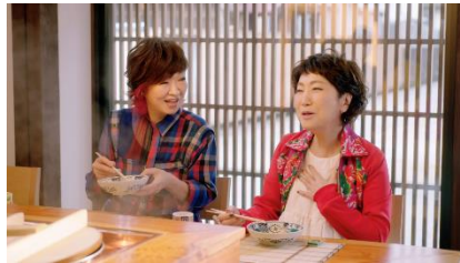
【CM「フィーリン3 金沢紀行篇」より】