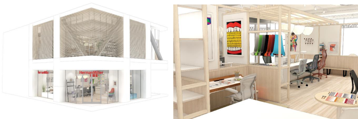
ハーマンミラーストア心齋橋イメージ

高機能オフィスチェアを人間工学に基づきマッチングするホームワークスペースソリューション体験を提供