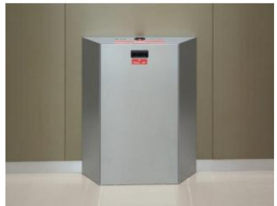
エレベーター用キャビネットフラットタイプ

エレベーターかご内に設置する器材。エレベーターかご内で被災した際に、必要な器具類がコンパクトに収納されています。（収納品例：保存水、非常用クッキー、LED ランタン、消臭剤、紙コップ、アルミブランケット、吸盤付きクリップ、トイレシート、冷却バンダナ、トイレトーパー、ポケットティッシュ、非常用ホイッスル）