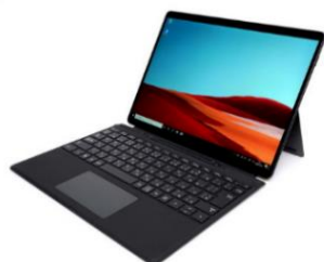
Microsoft 社製ノート PC Surface モデル