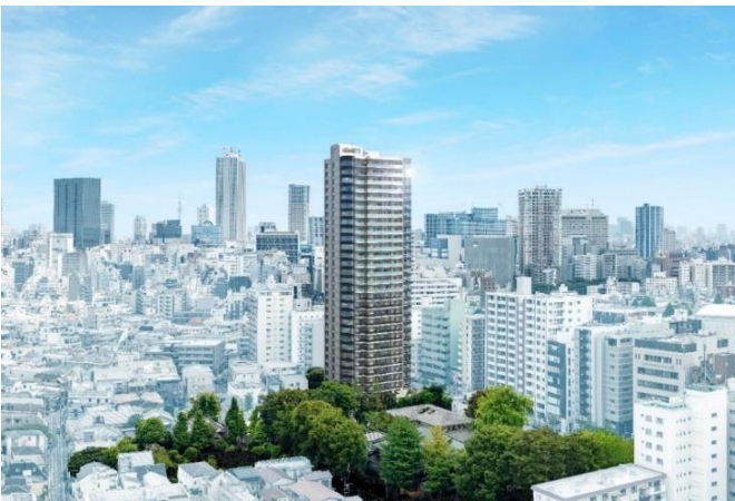
「Brillia Tower 池袋 West」外観イメージ

所在地：東京都豊島区池袋三丁目 1631-1、50、51 交通：東京メトロ丸ノ内線「池袋」駅徒歩 5 分、 JR 線・東武東上線・西武池袋線「池袋」駅徒歩 10 分、 東京メトロ有楽町線・副都心線「要町」駅徒歩 3 分 総戸数：230 戸、他店舗 1 区画 構造・規模：鉄筋コンクリート造 地上 30 階地下 1 階建 敷地面積：3,691.64 m 2 間取り：1LDK ～ 3LDK 専有面積：38.61 m 2 ～103.72 m 2 （トランクルーム 0.31 m 2 ～1.01 m 2 含む） 建物完成時期：2024 年 1 月下旬（予定） 入居開始時期：2024 年 3 月中旬（予定） 販売開始：2022 年 4 月下旬予定（第 1 期） 売主：東京建物株式会社、三菱地所レジデンス株式会社、東急不動産株式会社 設計施工：前田建設工業株式会社 管理：株式会社東京建物アメニティサポート 問い合わせ先：「ブリリアタワー池袋 West」販売準備室 TEL：0120-296-230 物件 H P： https://ikenishi.brillia.com/