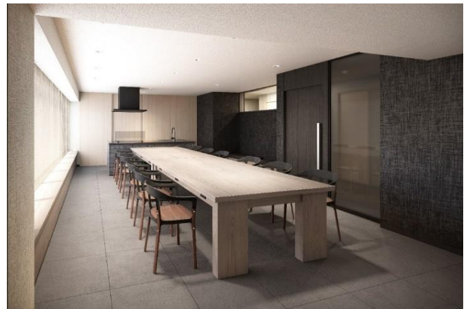
共用施設イメージ