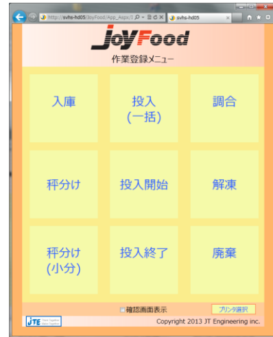
■作業登録メニュー：画面