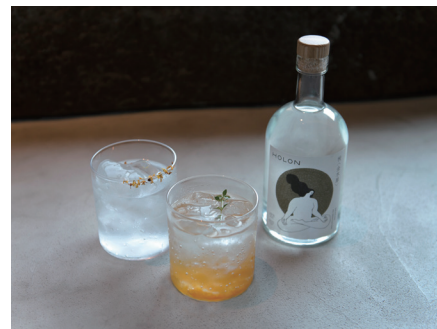
(左) 金木犀のジントニック

茶寮営業時間外は、夕食時もしくはルームサービスとして（21:00～23:30）お部屋でもお楽しみいただけます。