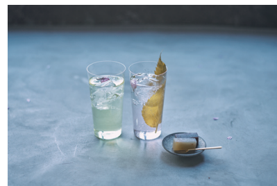
(左) 桜の緑茶ハイ (右) 桜葉のジントニック ※菓子は別売りです。