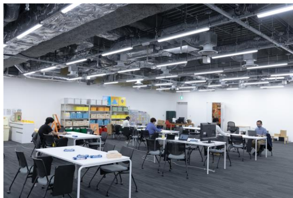
▲ 東京ランチが参加する CiP 協議会内観

本学では2016年度に「音楽で、はたらこう。」をテーマに、ミュージッククリエイション専攻・ミュージックコミュニケーション専攻を開設するなど、時代のニーズに合わせて、就職を意識した改革を進めてきました。「大阪音楽大学・東京ランチ」は首都圏での就職活動を徹底的にサポート。学生たちの将来の可能性を広げ、チャンスを実確なものにしていきます。音楽大学の就職に対する世間の概念を払拭し、今後も時流に沿った取り組みを行っていきます。