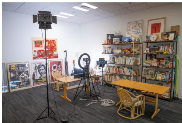
▲ 東京ランチが参加する CiP 協議会共有スペース 「配信スペース」