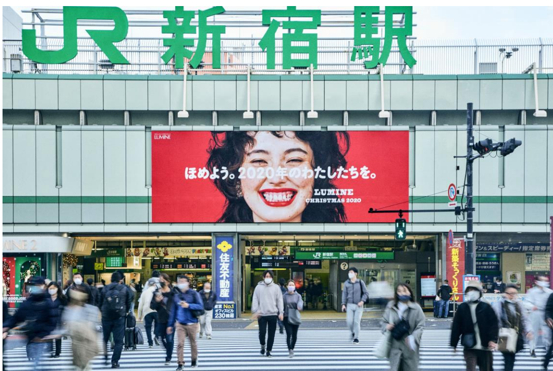
JR 東日本 新宿駅 大型ボード

11月17日（火）に公開した、2020年のルミネのクリスマスコンセプトやステートメント、総勢24名の女性たちが出演したスペシャルムービーなどをご覧いただいた方々から、「本当、今年のわたしたちを褒めてあげよう」「涙が出そうになった」「見つめ直すことがたくさんあった」「音楽もコンセプトと合っていて最高」など、多くの反響をお寄せいただいています。なかには、人目に留まる新宿駅の大型ボード掲出を前に足を止めて撮影される方の姿も見られます。1年を振り返りながら、今年のクリスマスの過ごし方に思いを巡らすひとときを、ルミネらしくご提案します。