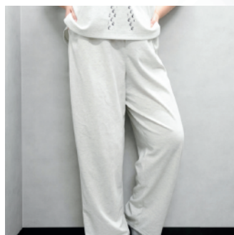
ラグザスルームウェアパンツ (長ズボン)