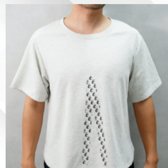
ラグザスルームウェア半袖Tシャツ