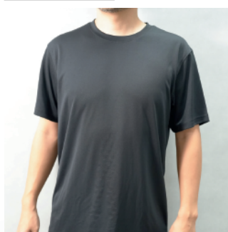
ラグザスTシャツ ￥11,000(税込)