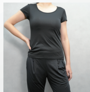
ラグザスインナー半袖 カップなし