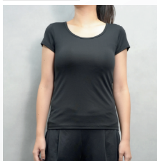
ラグザスインナー半袖 カップ付き