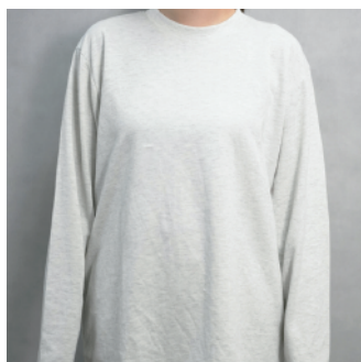
ラグザスルームウェア長袖Tシャツ