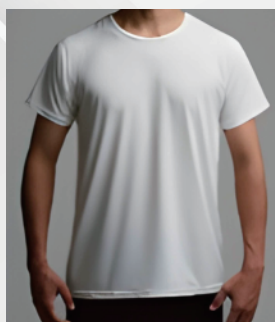
ラグザスインナー半袖