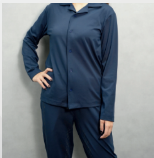
ラグザスパジャマ上下セット