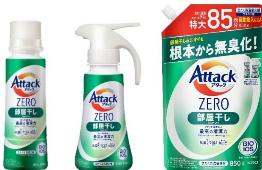
「アタック ZERO(ゼロ) 部屋干し」 左から ボトルタイプ(380g)、ワンハンドプッシュタイプ、つめかえ用(850g)