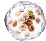
センレンシエキス イメージ

ンシエキス(保湿)」を、『アルブラン ザ ファーストエッセンス』(医薬部外品)にも配合しました。「センレンシエキス(保湿)」は、「トウセンダン」の果実から抽出した花王独自の保湿成分です。花王生物科学研究所が、「乾燥に悩む世界中の人々に寄り添いたい」「今後の花王グループの柱となるオリジナル保湿成分を開発したい」という思いから 2007 年に研究を開始。14 年もの歳月をかけて、約 1,600 種の植物系素材から厳選し、「ALBLANC」に配合しました。角層のすみずみまで潤いで満たし、くすみ感のない透明感のある肌に導きます。また、毛穴より小さいクリーミーな炭酸* 2 泡が、心地よく肌になじみます。お手入れのファーストステップに使用することで、うるおいで肌をやわらげ、次に使う化粧水のなじみをよくします。