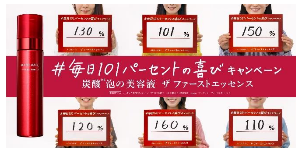
SNS キャンペーン“ザ ファーストエッセンスで、毎日 101 パーセントの喜びを積み上げていこう”

さらに、新しい生活様式における消費者の購買行動の変化に対応し、2023 年春よりオンライン接客をスタートする予定です。オンラインとオフラインの垣根を超えた活動でブランドファンづくりを推進していきます。