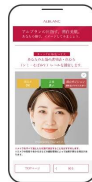
「潤白美肌シミュレーション」 イメージ