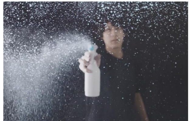
“連射ミスト”で隙間や重なりなく均一塗布できる https://www.youtube.com/watch?v=S6FC6y7uh2s