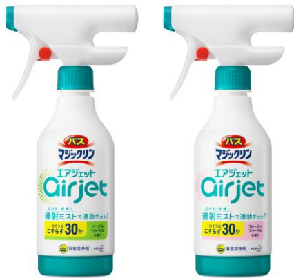
『バスマジックリン エアジェット』左から 「ハーバルシトラスの香り」「フルーティフローラルの香り」

花王株式会社(社長・長谷部佳宏)は、2021年9月8日、浴室用洗剤「バスマジックリン」シリーズから、誰でも簡単・確実にミストを塗布できる“連射ミスト”を採用し、新開発の“速効分解処方”で浴そうの残留汚れをこすらずに30秒待つだけで流すだけの次世代型バスクリナー「バスマジックリン エアジェット」を新発売します。家事の中でも担い手の多様化が進んでいるお風呂そうじで、老若男女を問わず、誰でもラクにキレイな仕上がりを実感いただけます。