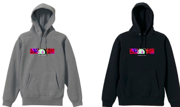
SWEAT PARKA BLACK / GRAY ¥7,800+TAX

「ハミィ」とコラボしたVR科学館限定のコラボグッズを12月26日より公式オンラインショップにて販売予定。ストアURL： https://vrkagakukan.theshop.jp