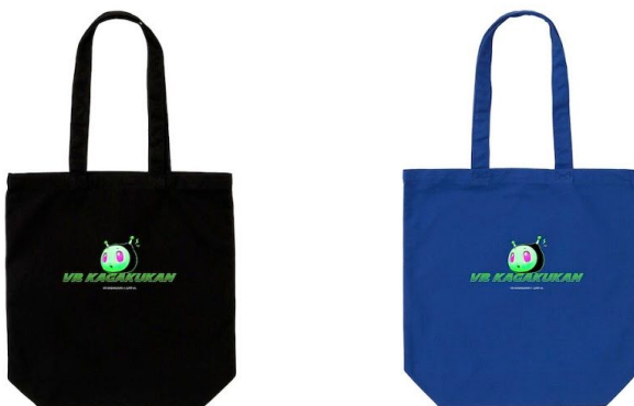
TOTE BAG BLACK / BLUE ¥2,900+TAX