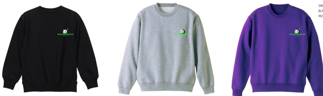
SWEAT PULLOVER BLACK / WHITE / PURPLE ¥6,900+TAX