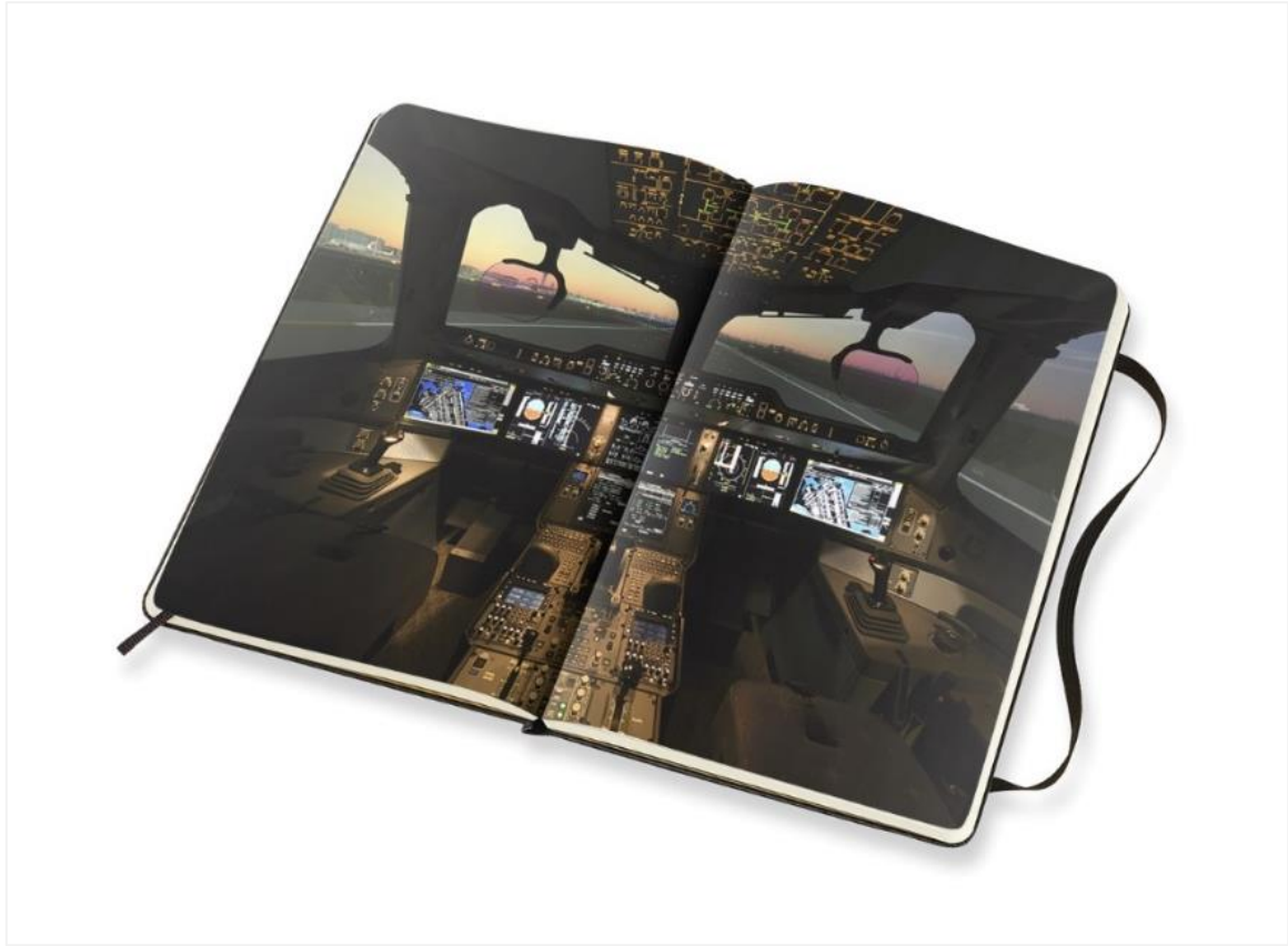
JALの大型ジェット機A350コックピット内部の写真を掲載