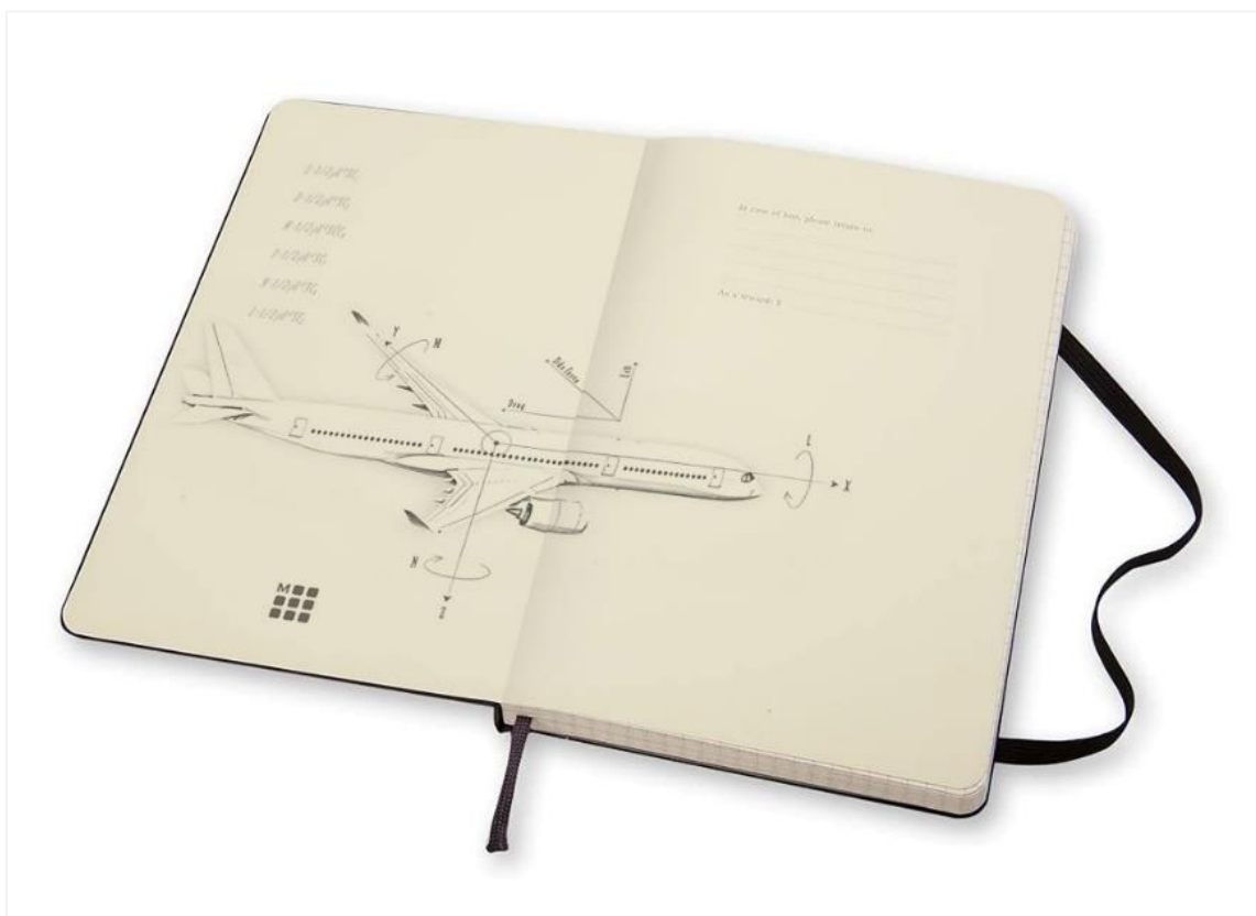
飛行機のイラストをあしらったデザイン