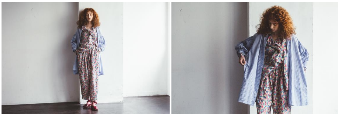
style 01. セットアップでリラックスなパジャマライクに。

イギリス文化の中でも代表的な、自然そのものの美しさを大切にしたい庭づくり“イギリス式庭園”。 そんな庭園に咲き誇る花々をイメージした華やかな花柄アイテムがリリース致しました。