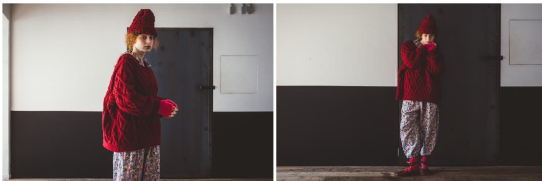
style 02. ニットアイテムをあわせて、あたたかな冬のおうちスタイル。