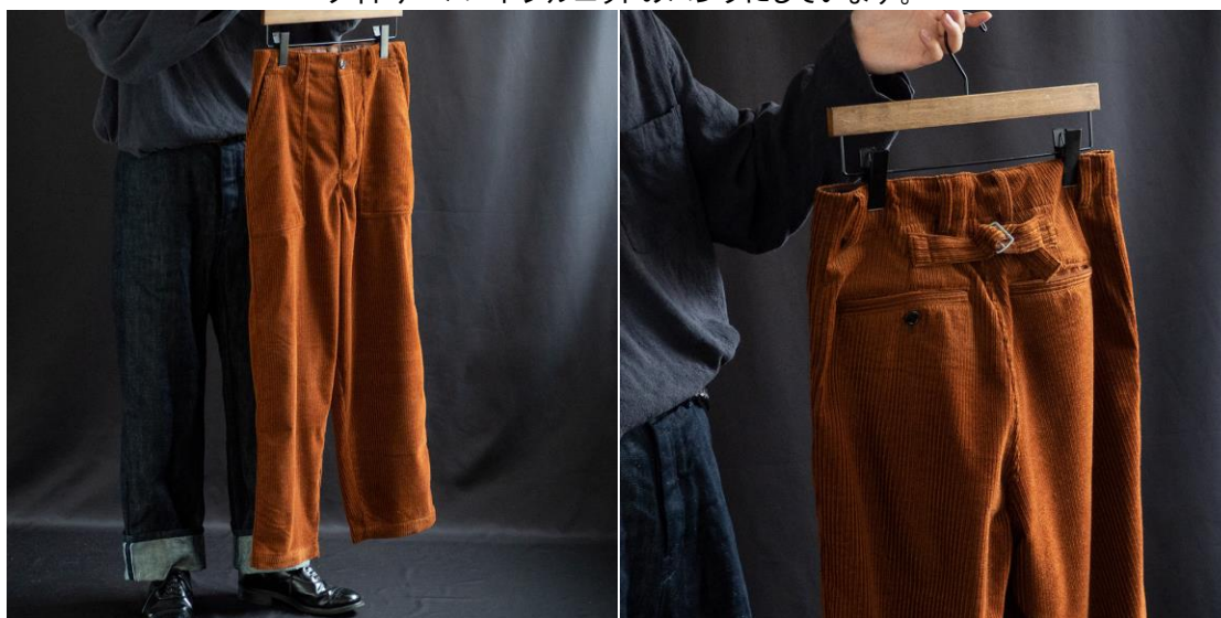
ウールコーデュロイファティーグパンツ ( Brick , C.Grey ) ¥30,800 (税込)

王道のファティーグパンツの仕様や巻き縫い縫製による武骨さを取り入れながら、 綺麗顔のウールコーデュロイのドレープが活きる、 ワイドテーパーシルエットのパンツにしています。