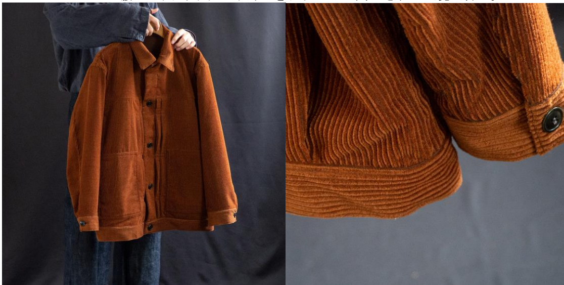
ウールコーデュロイトラッカージャケット ( Brick , C.Grey ) ¥39,600 (税込)

アクションブリーツに代表される象徴的なディテールを落とし込んだ G ジャン型。 流れる生地感を堪能すべく着丈を長くアレンジしたトラックージャケットです。 腰のパッチポケットの入り口をサイドにして、すっきりとした見た目に。