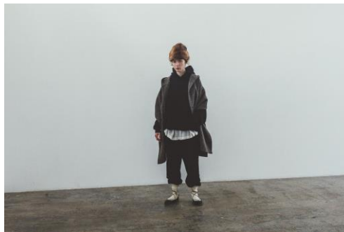
BASIC sweat ribbed pants / ¥15,400

https://store.nestrobe.com/nestrobe/itemdetail?ItemID=600215-7008&sci=2