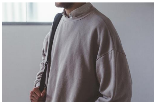
BASIC sweat oversized crew neck pullover / ¥13,200

2サイズ展開のビックシルエットの裏毛フーディー。長く着て頂くために、裾と袖口はストレッチ性のあるフライス生地を使用。柔らかく肌に馴染む着心地の良さは毎日でも着たくなる。