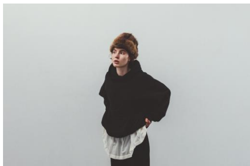
BASIC sweat oversized hoodie / ¥16,500

これまで白や生成り色の裁断くずのみを再生系にし、柄物や色が付いている裁断くずはハンガーへとアップサイクルしてきた。今シーズンより、色付きの裁断くずを再生系にし編み立てた“TOP GREY”カラーが初登場！様々な色味や柄の裁断くずが混ざり合うことで生まれる表情豊かで、奥行きのある“TOP GREY”に加え、“OFF WHITE”と“BLACK”のベーシックな3色展開。