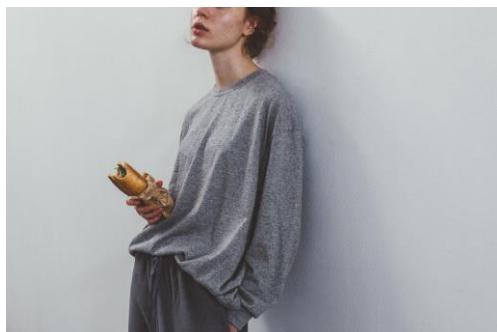
(左) BASIC jersey oversized crew neck pullover / ¥9,350

https://store.nestrobe.com/nestrobe/itemdetail?ItemID=600215-7009