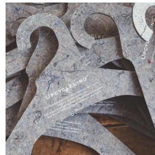
⑤ヴィンテージのような柔らかな風合いの洋服に。洋服にできない“裁断くず”はハンガーとして生まれ変わる。