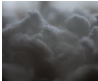
②細かく粉碎し、綿状に戻す。