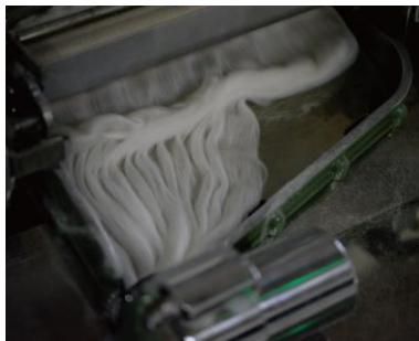
③撚り合わせ糸にする。