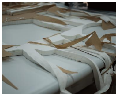
①これまで廃棄されていた“裁断くず”

•Instagram：@upcyclelino_jp ( https://www.instagram.com/upcyclelino_jp/ ) #upcyclelino #アップサイクルリノ