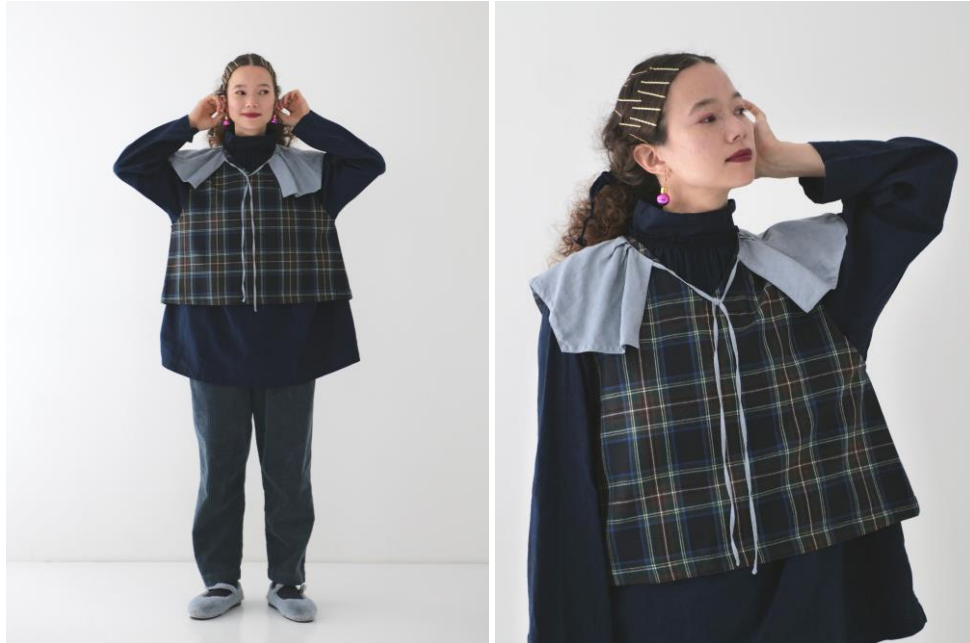
■ウールタータンチェック 2way ベスト / 19,800 円

https://store.nestrobe.com/nestrobe/itemdetail?ItemID=01224-1291&sci=36