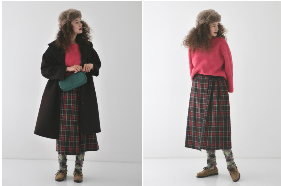
■ウールタータンチェック ラップライクスカート / 27,500 円

一方は V ネック、もう一方は、ボタン空きとなっており、さまざまな着こなしをお楽しみ頂けるアイテムです。ミニマムなショート丈なので、ボリューム感のあるボトムスやワンピースともバランス良く合わせて頂けます。