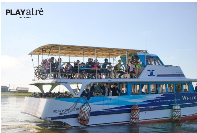
(過去大会時のサイクルーズの様子)