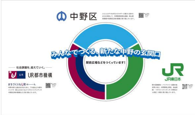
<みんなでつくる、新たな中野の玄関口>