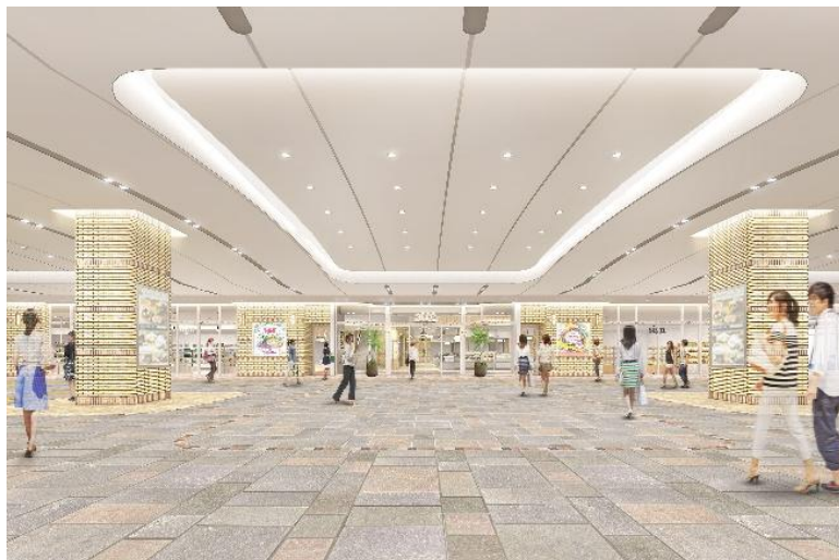
<2F エントランスイメージ>