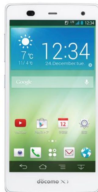
ARROWS NX F-01F

この「【富士通】ARROWS NX F-01F(docomo)」は、ユーザーの満足度向上を目指し、不満点を徹底解析し実現させた商品だそうで、富士通担当者は、「なかでも、電池持ち、画面の見易さ、つながりやすさ、端末の持ちやすさ、サクサク感など基本性能の満足度を向上させるための開発を徹底的に行いました」と、今回の高満足度につながった理由を明かす。また、「引き続きお客様満足度 No.1 を目指し、ARROWS は心地よく使えるを目指し商品開発を進めていきたい」と、更なる開発への意欲も見せている。