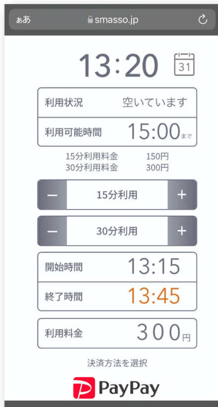
即時利用ができる場合

スマホ決済を利用できるため、専用アプリのダウンロードや利用者登録、クレジットカード登録など が必要なく、 手間をかけずに直ぐに利用開始 が可能となります。