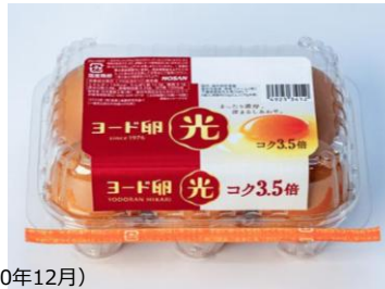
味質におけるヨード卵・光と他の一般的な卵の味質データ「五軸風味」の対比