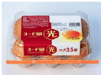
卵黄におけるヨード卵・光と他の一般的な卵の卵黄データ「卵黄種別」の対比

「ヨード卵・光」は1976年に誕生し2026年に発売50周年を迎えた日本初(※1)のブランド卵です。ブランド卵の先駆けとして、ニワトリの食べるものからこだわり、約20年の研究を経て「ヨード卵・光」専用飼料を開発、試行錯誤を繰り返しながら誕生しました。最大の特徴はコクが3.5倍(※2)であるということ。まったりとした濃厚さと旨味を感じられます。