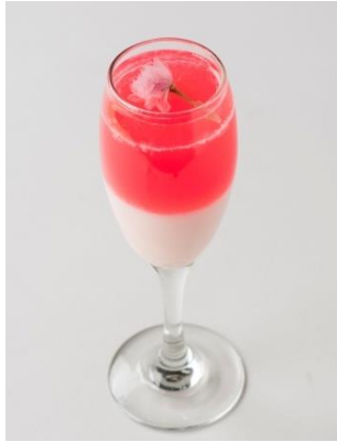
◆ルビーカフェ[3F] Sakura pudding set 単品500円/コーヒー・紅茶セット 700円 2層のさくらプリンに花びらを散りばめ、華やかな和プリン。※1日10食限定