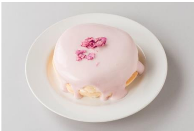
◆パドリーノ・デル・ショーザン[2F] 桜パンケーキ 1,500円 桜香る春らしい限定パンケーキ。 ランチのみ16：00まで ※数量限定