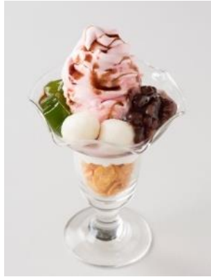
◆AROUND TABLE[1F] 春の甘味さくらパフェ 659円 桜アイスにゆであずき、白玉抹茶がトッピングされた甘味になっております。 ※1日限定10食