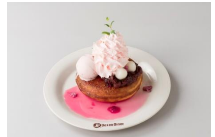
◆STEAK&CAFE by DexeeDiner[2F] 春の桜パンケーキ 980円 自家製桜ソースが美味しい、今まで当店になかった和テイストのパンケーキ。