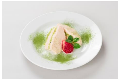
◆イルフォルノ[2F] 桜ティラミス 650円 ドルチェセット(ドリンク付) 1,100円 ほんのり桜の香るティラミスを作りました。