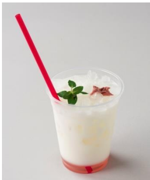
◆インドカレーダイニング コバラハッタ[3F] サクララッシー付き 一種カレー&ナンプレート 1,000円 桜香る期間限定ラッシーと当店のカレーセット。