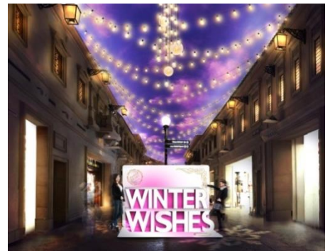
&lt;サウスアヴェニュー&gt;

今年のヴィーナスフォートは、中世ヨーロッパの街並みを再現した館内を、電球色のイルミネーションやキャンドルライトに見立てたゆらゆら揺れる光など、優しく心温まる演出で彩ります。