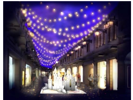
&lt;ノースアヴェニュー&gt;