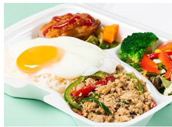
GREEN ASIA TOKYO[3F] ガバオライス弁当 756円(税込)

2種類の鶏挽肉とタイハーブのガバオリーフを使用。GREEN ASIA TOKYO 人気No.1メニューです！