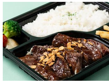
GRILL & BAR うしすけ[1F] 牛ハラミのガーリックグリル 1,480円(税込)

大人気の牛ハラミがお弁当になりました。香ばしいオニオンソースとアクセントのガーリックチップで召し上げ！