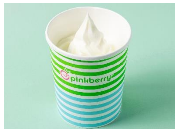
ピンクベリー[2F] フローズンヨーグルト 928円(税込)

テイクアウト限定！一度食べたらくせになるBBQポークとチェダーチーズのベストコンビ！