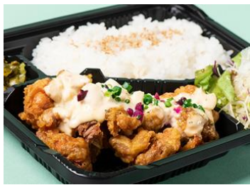
新潟農家直送米 黄金めし[3F] チキン南蛮定食 1,004円(税込)

2種類の鶏挽肉とタイハーブのガバオリーフを使用。GREEN ASIA TOKYO 人気No.1メニューです！