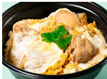
あぶりどりの親子丼 丼米[3F] 炙りどりの親子丼 864円(税込)

大人気の牛ハラミがお弁当になりました。香ばしいオニオンソースとアクセントのガーリックチップで召し上げ！