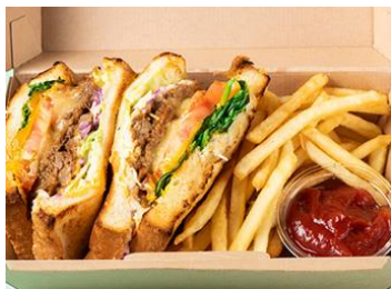
湘南パンケーキ[2F] プルドポークメルトサンド (ポテト付) 1,274円(税込)

汗ばむ季節にぴったりの甘酸っぱく爽やかなレモネードです。ソーダの有り・無しを選べます。