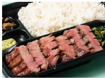
仙台牛タンと伊達ごはん だてなり屋[2F] 極厚切りトロ牛タン弁当 1,944円(税込)