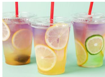
ルビーカフェ[3F] パタフライピーレモネード 626円(税込)

汗ばむ季節にぴったりの甘酸っぱく爽やかなレモネードです。ソーダの有り・無しを選べます。