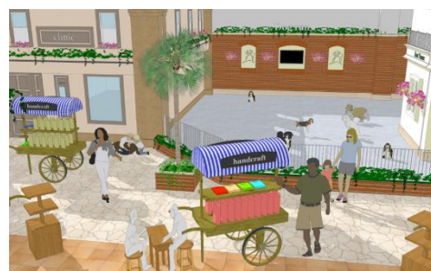
広い店内にはドッグランも併設

～ヴィーナズフォートは従来より、ペット連れのお客様のために様々な取り組みを行っています～