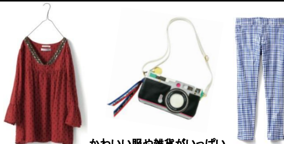
かわいい服や雑貨がいっぱい

かわいい通販でおなじみ『フェリシモ』のリアルショップ。 「毎日着たくなる、おしゃれでかわいいふだん着」を中心に、服や雑貨を取りそろえています。カタログでは伝えきれない素材感や着心地などをお楽しみいただけるのもショップならではの。期間限定のお得商品やショップ限定アイテムもご用意しています。