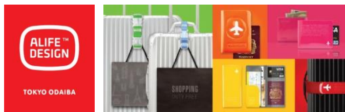
ヴィヴィットなカラーが人気のトラベルグッズ

「格好良いのもありだけど可愛いのもいいかも。」 アリフのデザイン性とヴィヴィットなカラーは、ヨーロッパで絶大な人気を得ています。全てのALIFE商品が揃う当店舗で、あなたをハッピーにする旅のラッキーカラーアイテムをご提案します。