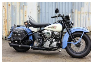
旧車モデルの新車バイクも販売

アメリカンモーターサイクルカルチャーをコンセプトにしたガレージ風の店内に、国内トップレベルのカスタムバイクやバイク搭載可能なキャンピングカーをはじめ、ウェア、グッズ、アクセサリ等を取り揃えたバイカーズショップ。日本の各界を代表する職人たちが造り上げた数々の作品が、通路を挟んで約300㎡の店内にところ狭しと並びます。またカフェスペースも併設し、バイカーはもちろんバイカーファンが集える憩いの場を提供します。