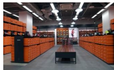
世界共通のスタイリッシュなストアデザイン