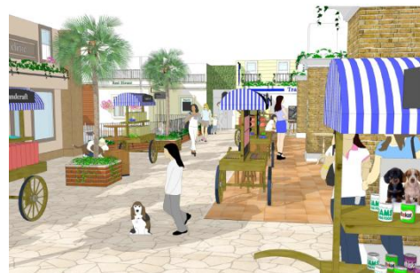
西海岸の町並みをモチーフとした空間