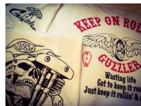
バイカー御用達ブランドが充実

■ジャンル: バイク関連グッズ / ■フロア: 2F Venus GRAND / ■営業時間: 11:00~21:00