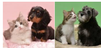
<JOKER'S TOWN >