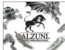
財布やベルトのセミオーダーも可能

■ジャンル: レザーグッズ、アクセサリ / ■フロア: 2F Venus GRAND / ■営業時間: 11:00~21:00