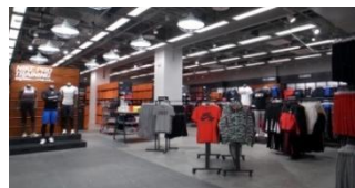
<NIKE FACTORY STORE>