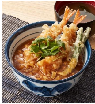
『あんかけ海老天丼』 790 円