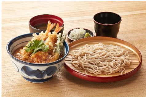
『あんかけ海老天丼サービスセット』 1,000 円

サクッとした歯触りの海老 2 本に鮮やかなとろっと玉子をふんわりとかけた天丼です。かつお節とこんぶの合わせだしの旨みを感じてください。