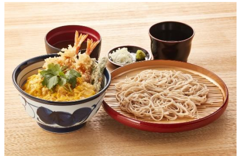
『とろっと玉子の海老天丼サービスセット』 1,000 円

小そば（または小うどん）が通常価格より 40 円お得にお召し上がりいただける、あんかけ海老天丼とのセットメニューです。