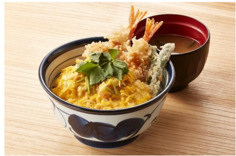
『とろっと玉子の海老天丼』 790 円

サクッとした歯触りの海老 2 本に、てんやオリジナル「特製和風あん」で楽しんでいただく天丼。やさしいかつお節だしの香りが特長です。