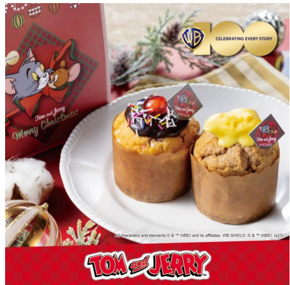
写真左：トム バナナスプリット風マフィン 写真右：ジェリー キャラメルチーズマフィン ※商品はイメージです。 ※販売価格はすべて税込です。

2 種×各 2 個 テイクアウト 1,580 円/店内 1,609 円 「トム バナナスプリット風マフィン」と「ジェリー キャラメルチーズマフィン」各 2 個を詰め合わせたセットです。キュートな限定パッケージでクリスマスシーズンのお土産にもぴったりです。