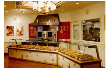
1993 年オープン当時の外観・内観