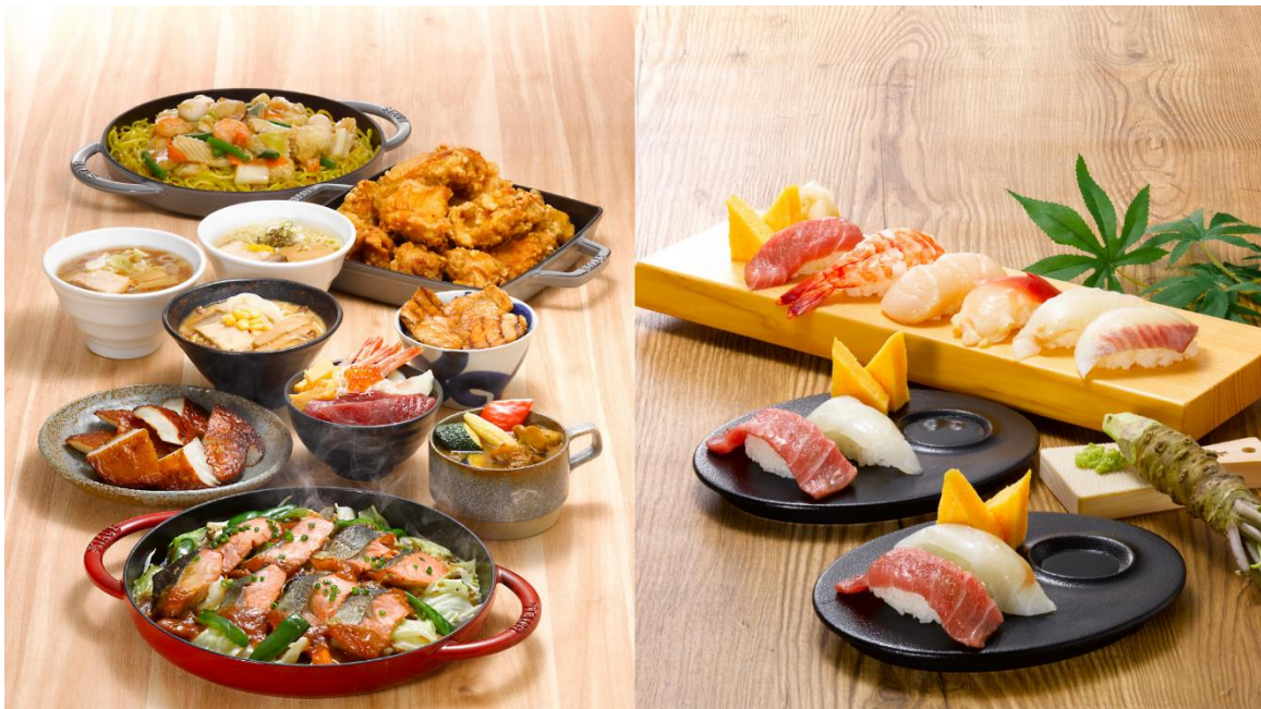
北海道名物を取り揃えた朝食メニュー