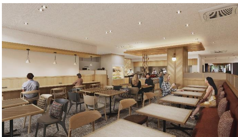
「モディッシュ札幌」店内

ホテル1階の直営レストラン「モディッシュ札幌」は、地元の皆さまや観光のお客さまにも長く愛されてきたレストランです。今回のリニューアルでは座席数やビュッフェレーンを増やし、木目調のあたたかみある店内に生まれ変わります。朝食は北海道名物を取り入れたビュッフェ、ランチでは洋食中心のハーフビュッフェを提供いたします。また、16時からのご宿泊のお客さま限定でラウンジとしてご利用いただけます。コンセントを配したカウンター席などもあり、ビジネスでのご利用や談笑など思い思いの時間をお過ごしいただける空間となっています。