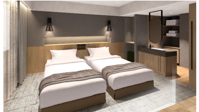
ジュニアスイートツインルーム