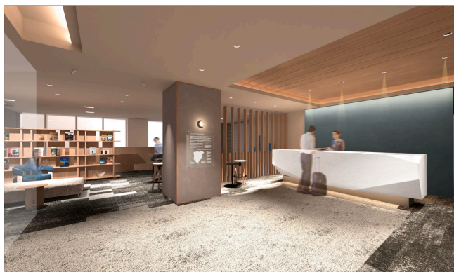
フロントカウンター