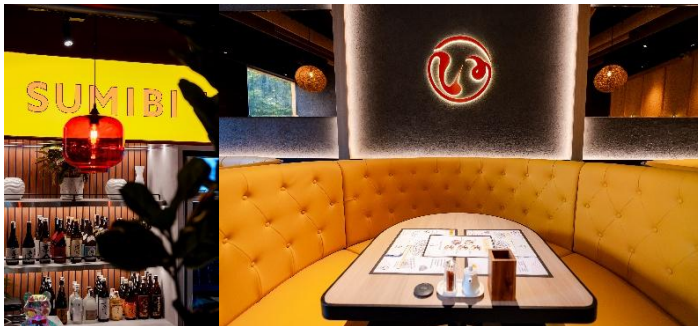
〈 炭火いねや（SUMIBI INEYA） 〉