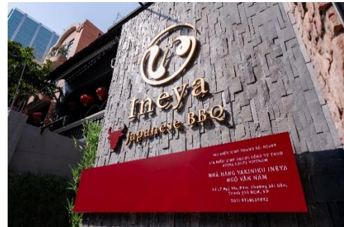
〈 焼肉いねや（YAKINIKU INEYA） 〉