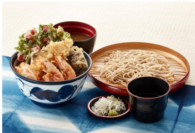
『冬天丼サービスセット』