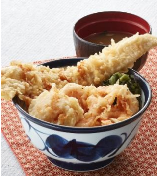
『ごちそう天井（冬）（みそ汁付）』 1,000 円