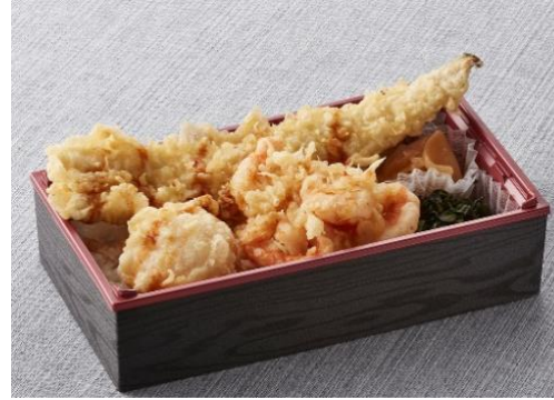
『ごちそう天重弁当（冬）（広島菜・お新香付）』 1,000 円