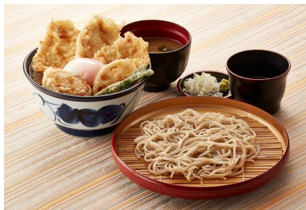
『親子鶏天丼サービスセット』