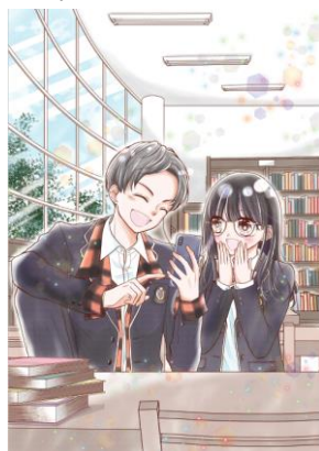
「わたしは図書室シンデレラ 恋のダンスで魔法を解いて!」 by あずき友里先生 ©SBD