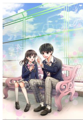
「初恋ダイヤモンド」 by 辻永ひつじ先生 ©SBD