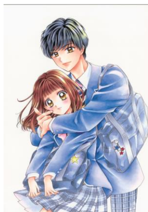
「ひなたに落ちた流れ星」 by 如月ゆきの先生 ©SBD