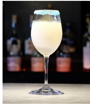
Daisy/「the twinkle of YOKOHAMA illumination ～煌めく横浜イルミネーション～」