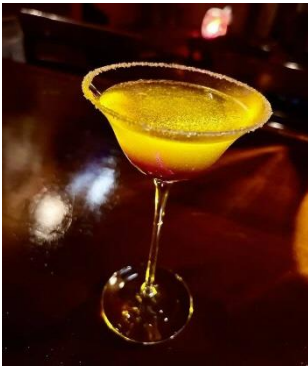
TWIN SOUL/「Healing effects(ヒーリング エフェクト)」

詳しくは、HPをご確認ください( https://cocktail.yokohama/ )