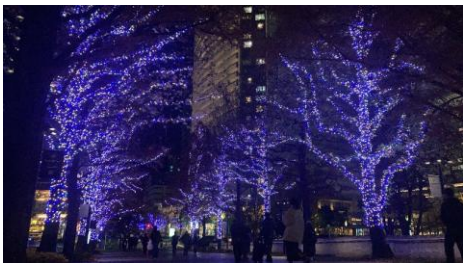
ヨコハママライト2025 ～みらいを照らす、光のまち～