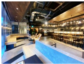
BACON Books & cafe