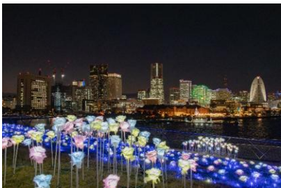
横浜港フォトジェニック イルミネーション2025