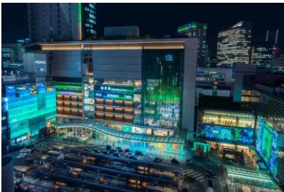
ヨコハマイルミネーションニシグチ2025 ヨコハマイルミナスクエア