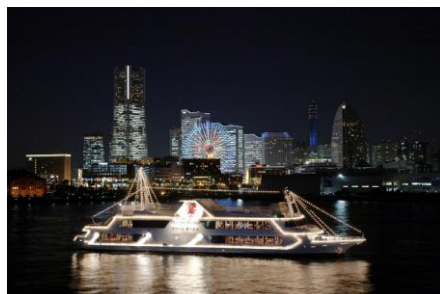
(賞品例) マリーナルージュ ペアディナークルーズ

東京カメラ部キャンペーンInstagram: https://www.instagram.com/tokyocameraclub_cp31