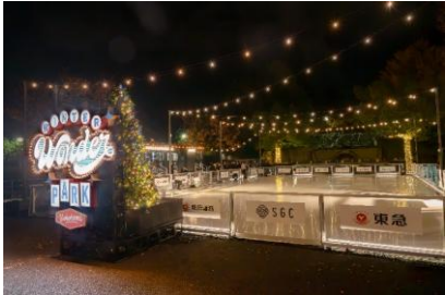
Winter Wonder Park Yokohama 2025-26