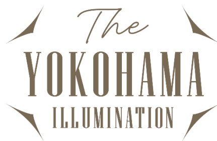
「THE YOKOHAMA ILLUMINATION」ロゴ