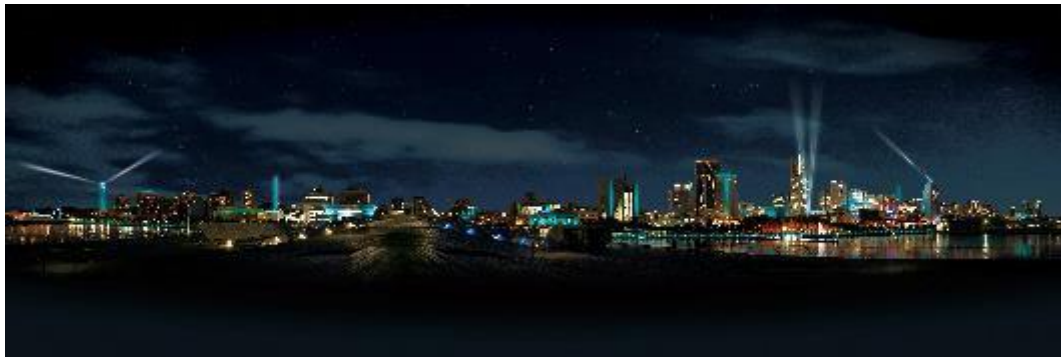
NIGHT VIEWING (大さん橋から山下公園側とみなとみらい側)

また、今年は新たに臨港パークや山下公園など8か所で、「NIGHT VIEWING」の際に、光の演出とともに音楽をお楽しみいただけます。