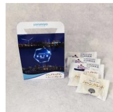
ヨルノヨオリジナルパッケージ ハーバー&ムーンガレット引換券 50名様

「ハマぶらりー」は、ヨルノヨの開催期間中(11月24日~1月3日)に、都心臨海部で行われるイルミネーションを巡ってスタンプを集めると素敵な景品が当たるデジタルスタンプラリーや、食事やショッピングがお得に楽しめるデジタルクーポンなど、横浜の夜をぶらりと楽しむキャンペーンです。