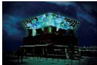
② 大さん橋ふ頭ビル