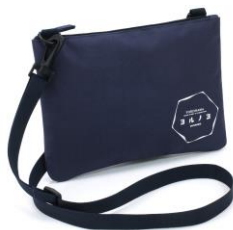
キタムラヨルノヨ オリジナルサコッシュ 50名様