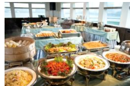
ロイヤルウイングディナーバイキングペアギフト券 1組2名様