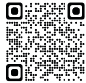
ARフィルターの使い方やダウンロードはこちら