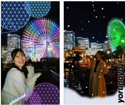
左)光のボールが輝くARフィルター「Light Ball AR」 右)雪が舞い散るARフィルター「SnowAR」

横浜の街を楽しく巡って頂くため、株式会社ProVisionの協力により、Instagram用ARフィルターを作成しました。Instagramがインストールされているスマートフォンで、下記QRコードを読み取ると、素敵なフレームで写真撮影を楽しめます。