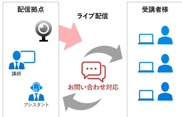
ご提供イメージ図