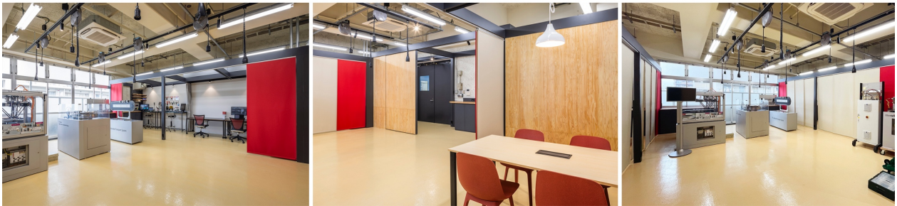
共創ラボ内観