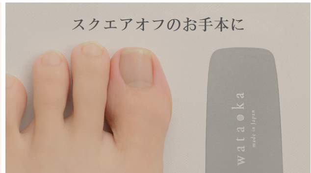
幅広側の端の形状は「正しい形・スクエアオフ」のガイドに