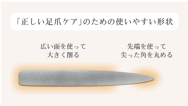
やすりの形状のポイント

硬く厚くなりがちな足爪のために仕上げられた新発想のやすり目と細部まで自在に行き届く形状、従来の「伸びたら短く切る」というなんとなくの慣習を「正しい形でトラブルを防ぐ」足爪のセルフケアへと進化させました。