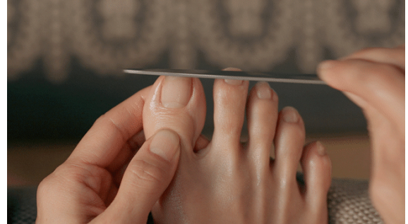
爪の先端を直線的に整えることにこだわった商品

硬く厚くなりがちな足爪のために仕上げられた新発想のやすり目と細部まで自在に行き届く形状、従来の「伸びたら短く切る」というなんとなくの慣習を「正しい形でトラブルを防ぐ」足爪のセルフケアへと進化させました。