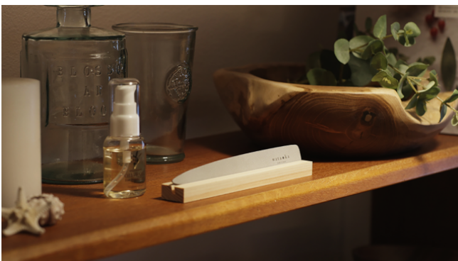
インテリアに馴染むスタンド付き

その世界観は、ワタオカの「なめらか爪やすり」「すべらか踵やすり」につづく、ヘルスケアやすりシリーズのとしての統一感を重視。老若男女誰でも手に取れるモダンでスタンダードな印象でありながら、老舗ヤスリメーカーの技と誠実さを感じさせるデザインとしました。