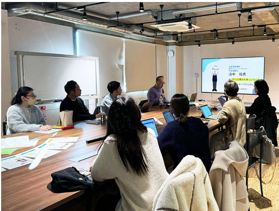
各先生による発表の様子

今回は、成安造形大学、京都ノートルダム女子大学、大阪工業大学、神戸親和大学のデザイン教育に携わる先生と学生が集まり、「PBL（課題解決型学習）と〇〇連携」と「Faculty Community」という2つのテーマに基づき、各大学で実践している授業内容や教育現場の生の声や、それらの課題についての発表と意見交換がありました。