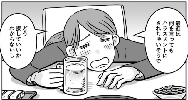
「ハラスメントハラスメント」より