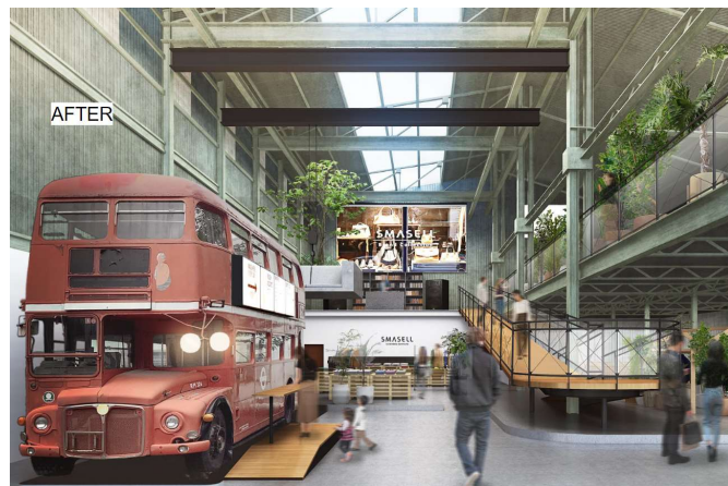
リノベーション後（完成予想図）